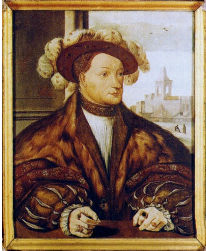
Karel van Egmond, hertog van Gelre (1467-1538)