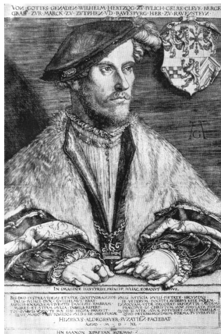
Willem van Gulik en Kleef

Op 27 januari 1538 werd op de landdag te Nijmegen de oorkonde bezegeld, waarin hertog Karel van Gelre tot zijn opvolger Willem van Gulik en Kleef, enige zoon van hertog Johan III van Kleef aannam.