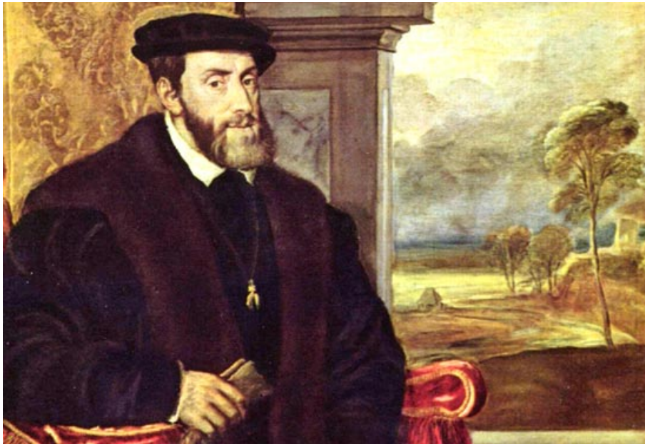
Karel V (München, Bayerische Staatsgemäldesammlungen, Alte Pinakothek)