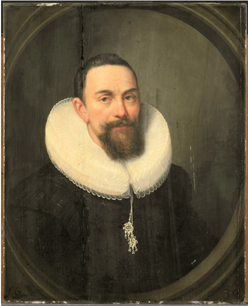
René van Chalon, prins van Oranje